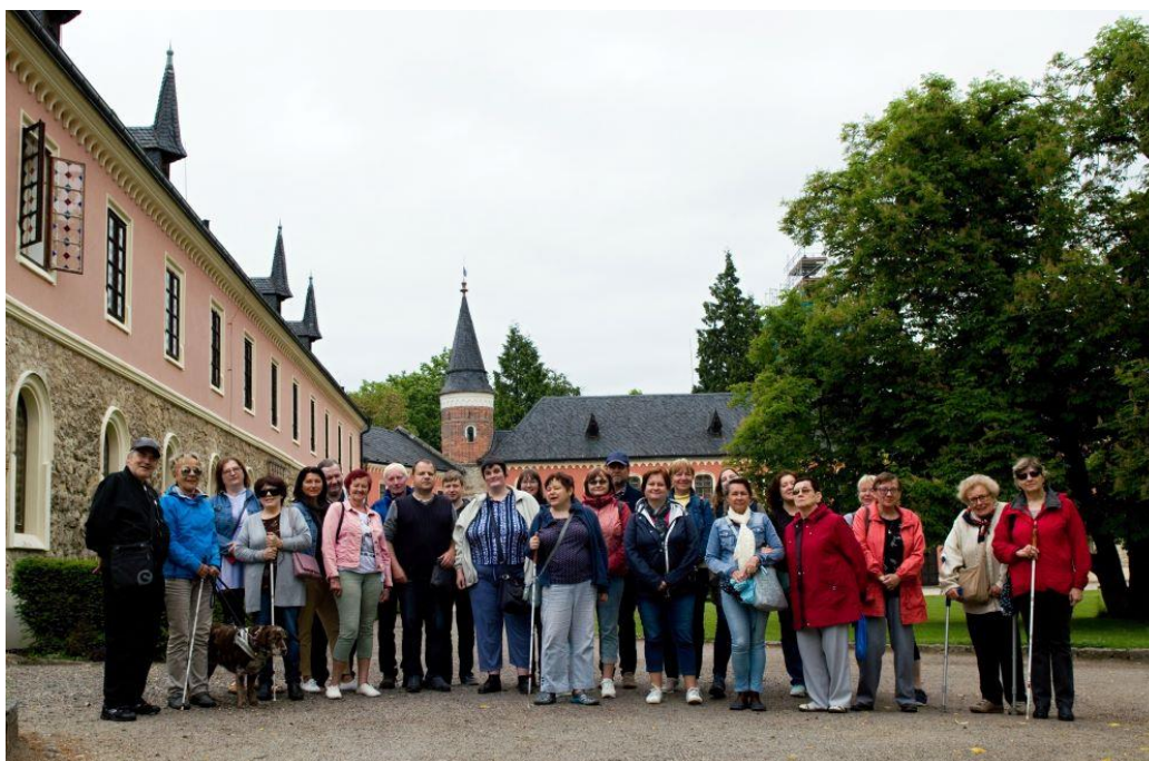
Pobyt v Jizerských horách