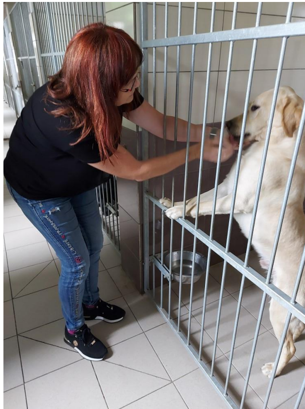
Středisko výcviku vodících psů

Čtvrt roku uběhlo jako voda a my tu máme opět náš nový program – hravý čtvrtek. Opět potrápíme hlavičky záludnými kvízy, přesmyčkami i znělkami z filmů a pohádek.