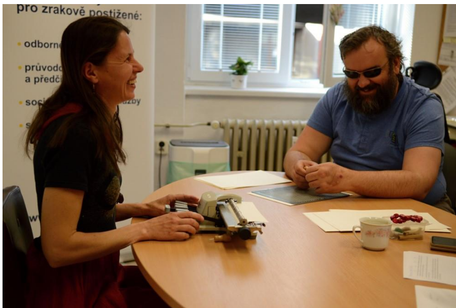
Soutěž v Brailu